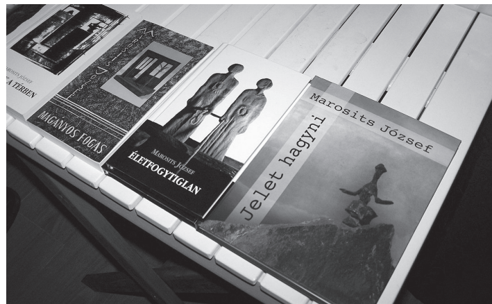
A „Jelet hagyni” korábbi kötetek mellett