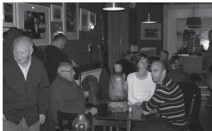
A művész szobrai is láthatók voltak